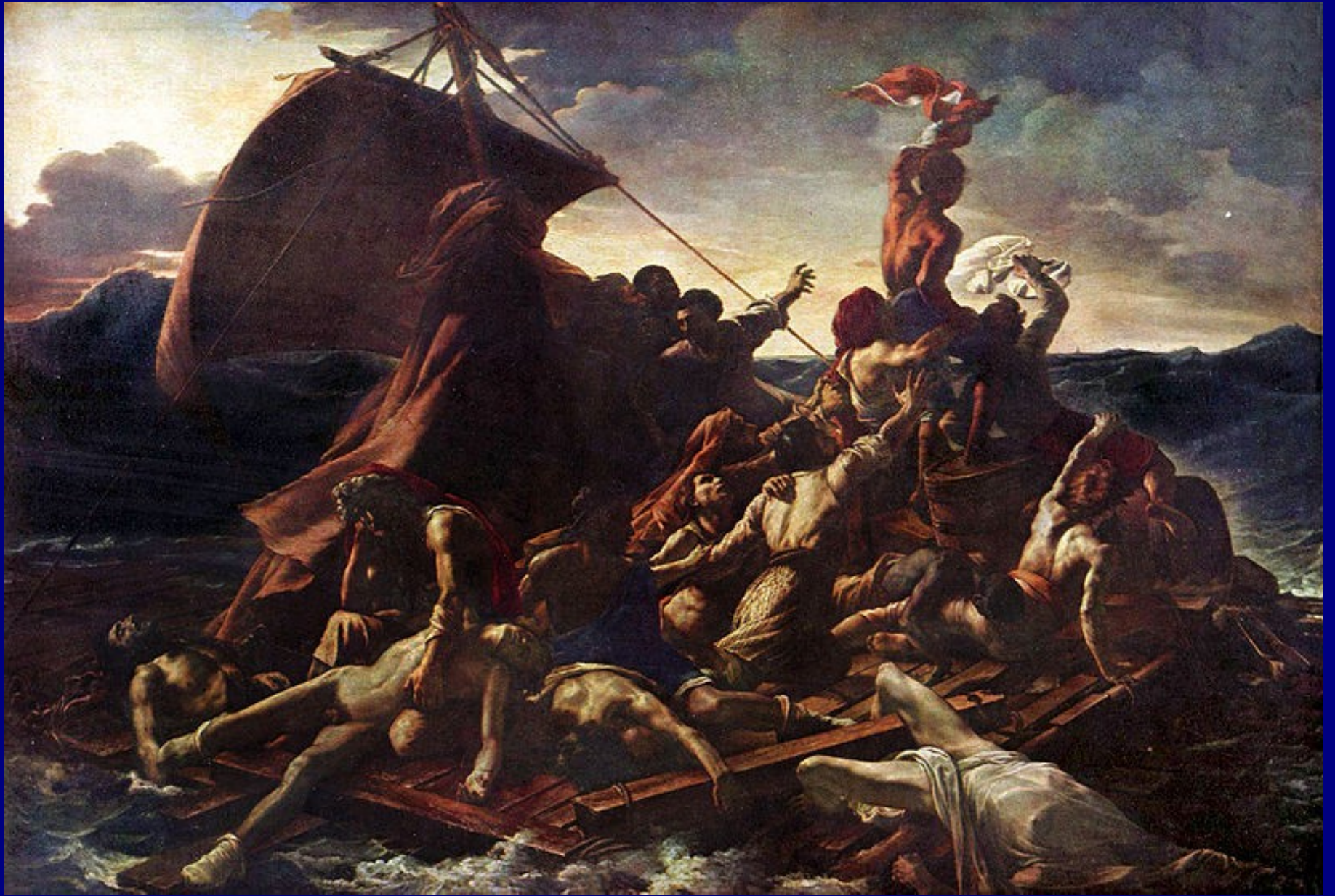
J.L.T. Gericault, La zattera della medusa , 1818