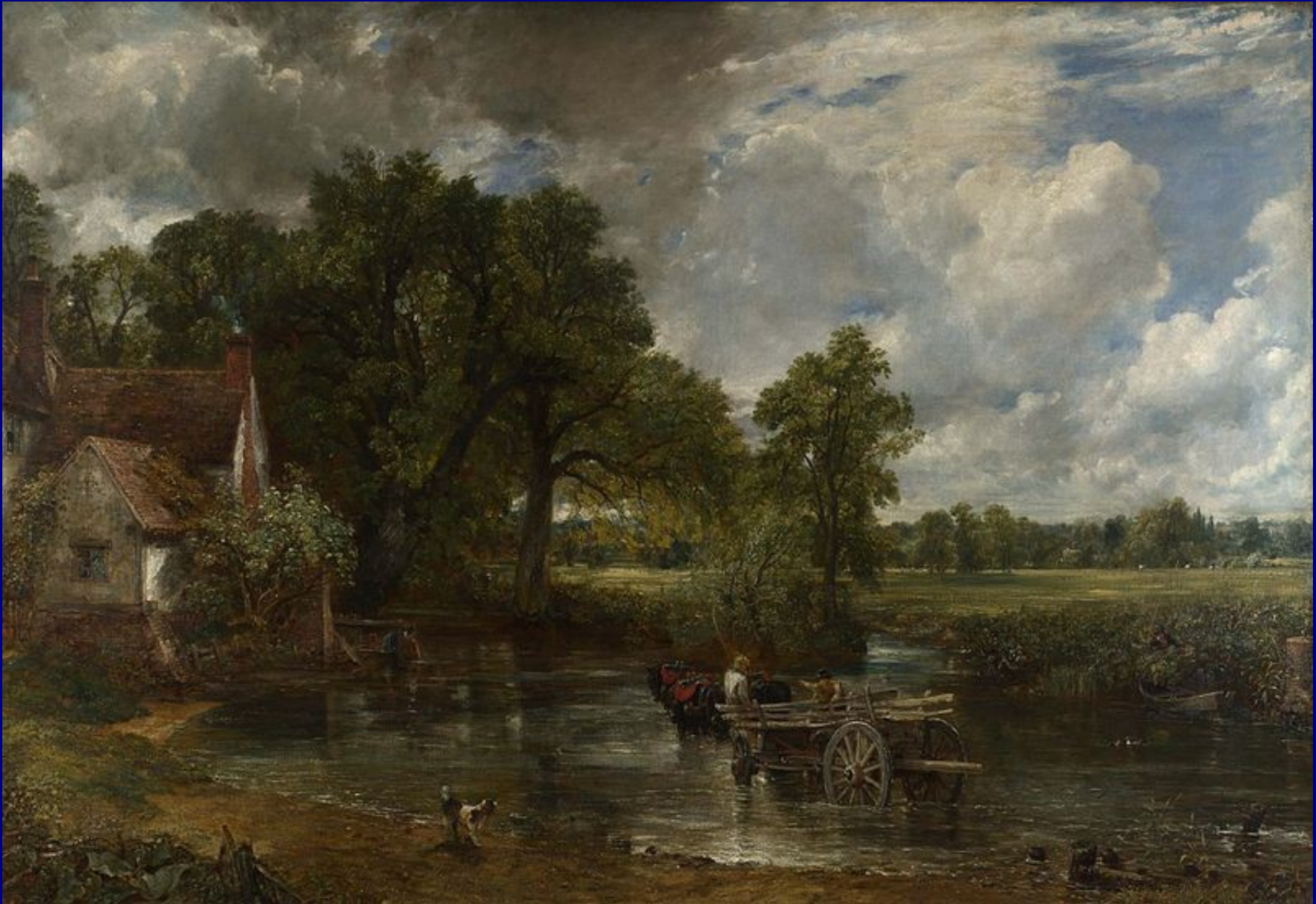
John Constable, Il carro da fieno , 1821