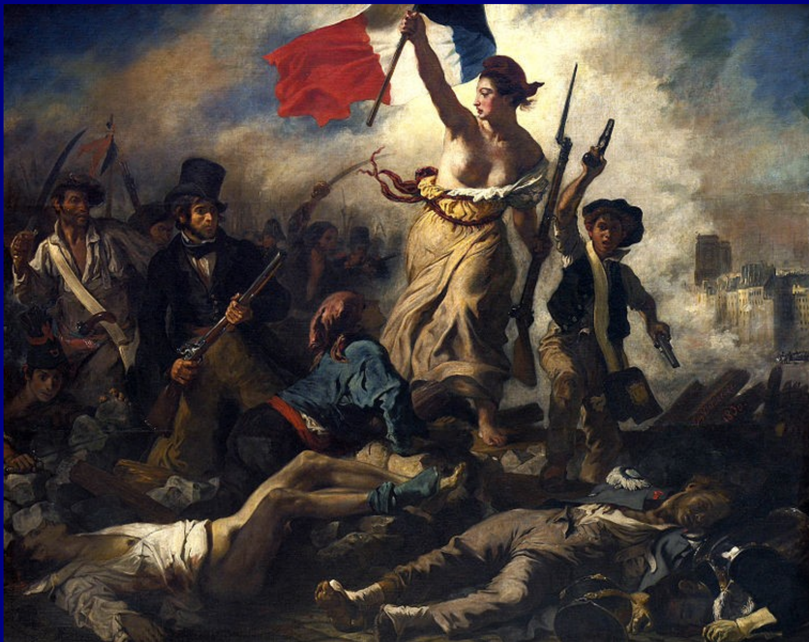
Eugene Delacroix, La libertà guida il popolo , 1830