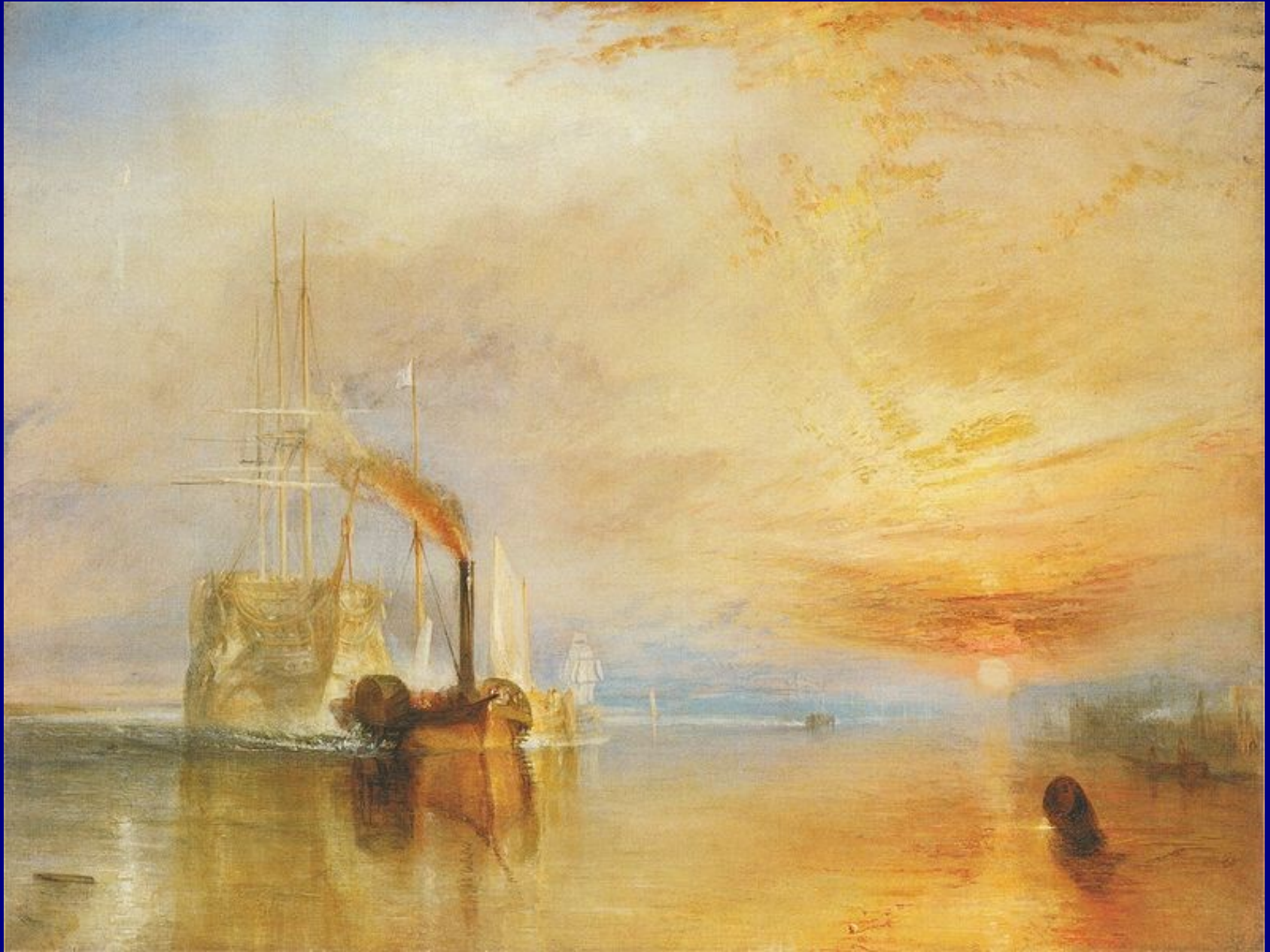
William Turner, La valorosa Temeraire , 1838