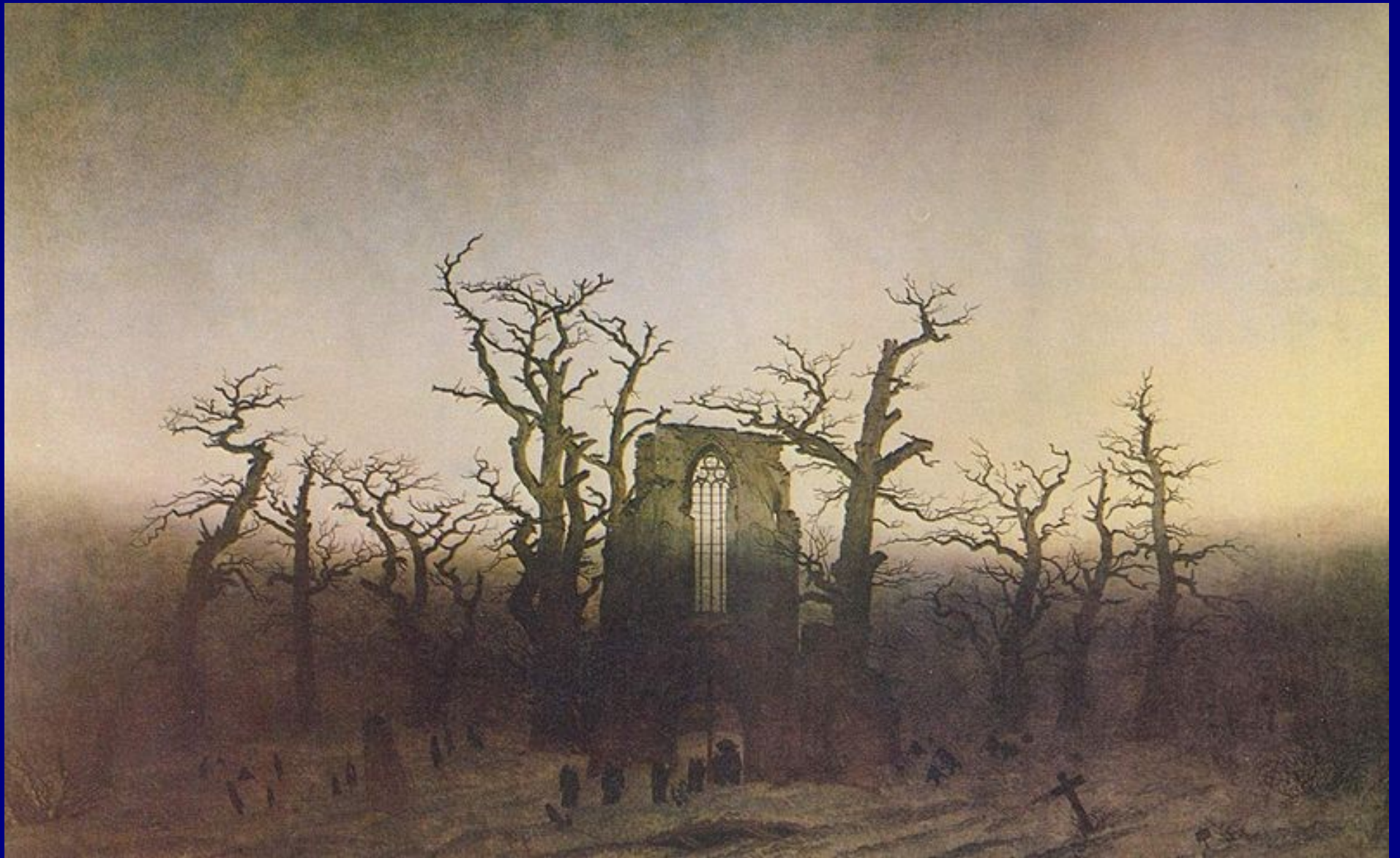
Caspar David Friedrich, Abbazia nel querceto , 1810