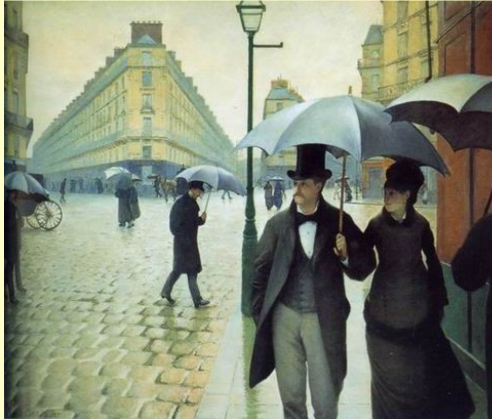
G.Caillebotte, Strada di Parigi, 1877 Chicago, The Art Institute